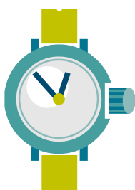
Den är fem före ett