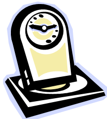
Den är kvart (femton) över nio