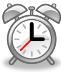
Den är tre Klockan är tre