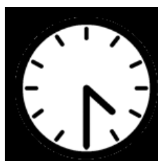
Den är halv fem Klockan är halv fem