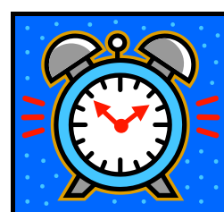
Den är tio över tio Klockan är tio över tio