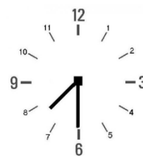
Den är halv åtta