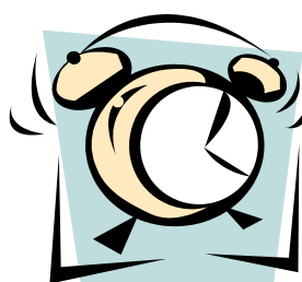
Den är fem över fyra