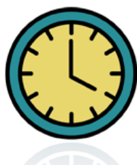
Den är fyra Klockan är